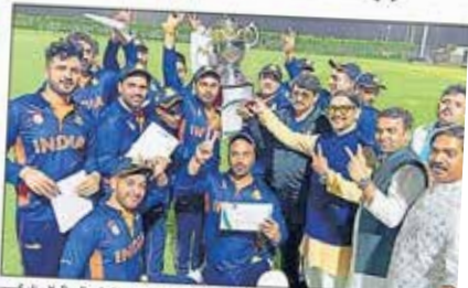
दुबई में ट्रॉफी जीतने के बाद जयन बनाने सेंट कोलंबस क्रिकेट अकादमी के खिलाड़ी।

फरीदाबाद, कार्यालय संवाददाता। हर के दयालका श्वर सेंट कोलंबस स्कूल की क्रिकेट टीम ने अंतरराष्ट्रीय अंतरविद्यालयी त्रिकोणीय क्रिकेट टूर्नामेंट में श्रीलंका, मॉरिशस, नेपाल व सिंगापुर की टीमों से भीतरा लिये। सेंट कोलंबस क्रिकेट टीम ने सभी में जीत हाई है, इसके सिवा स्कूल प्रबंधन ने प्र कसे कर्वाई की है।