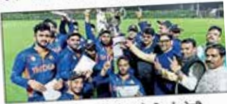
सेंट कोलंबस की टीम को दी गई ट्रॉफी एवन टीम ने जीता पुरस्कार

एम्ब्रोटी म्यूर, फरीदाबाद : दयालका श्वर सेंट कोलंबस स्कूल की क्रिकेट टीम दुबई में चल रही इंटरस्कूल ट्रिपल स्कोरिंग टूर्नामेंट में भाग लेने के लिए गये थे। वे श्रीलंका, मॉरिशस, नेपाल व सिंगापुर की टीमों से भीतरा लिये। सेंट कोलंबस क्रिकेट टीम ने सभी में जीत हाई है, इसके सिवा स्कूल प्रबंधन ने प्र कसे कर्वाई की है।