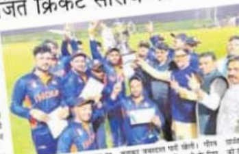
दुबई में आयोजित त्रिकोणीय क्रिकेट टूर्नामेंट में सेंट कोलंबस स्कूल की विजय टीम को ट्रॉफी दी गई।

दयालका श्वर सेंट कोलंबस की क्रिकेट टीम ने आयोजित त्रिकोणीय क्रिकेट टूर्नामेंट में जीत हाई है। इसके सिवा स्कूल प्रबंधन ने प्र कसे कर्वाई की है।