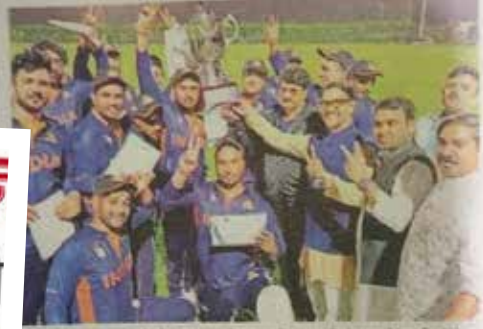
सेंट कोलंबस स्कूल की टीम अंतरराष्ट्रीय अंतरविद्यालय क्रिकेट टूर्नामेंट जीतने के बाद दुबई जाकर लौट रही है।

जस, फरीदाबाद : दुबई में संपन्न हुई अंतरराष्ट्रीय अंतरविद्यालय त्रिकोणीय क्रिकेट टूर्नामेंट में सेंट कोलंबस की टीम ने श्रीलंका, मॉरिशस, नेपाल और सिंगापुर के खिलाफ जीत का परचम लहराया।